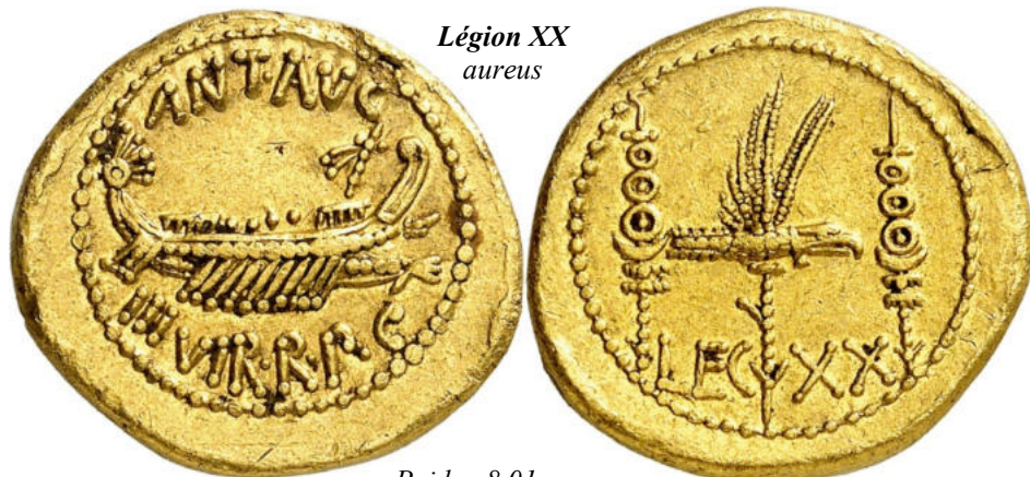
Légion XX aureus

Poids : 8,01 grammes Vente aux enchères 12 - Numismatica Genevensis SA Prix réalisé : 140.000 CHF