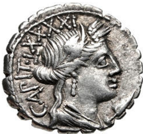
Une seconde monnaie - Vente CNG 375 - Lot 663 A noter le numéro de contrôle 91.

----- En conclusion ces deux interprétations ne sont pas antinomiques. La monnaie aurait très bien pu être une monnaie commémorative de la fondation d'Eporedia contenant en plus un message politique compréhensible par tous.