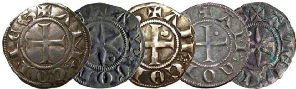
Quelques deniers d'Amédée IV

Il décède en 1253 à Montmélian et est inhumé à Hautecombe.