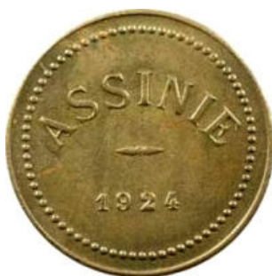
Année : 1924 Poids 4,60 grammes Diamètre 25 mm

Siège de l'exploitation : Grand-Bassam puis Assinie.