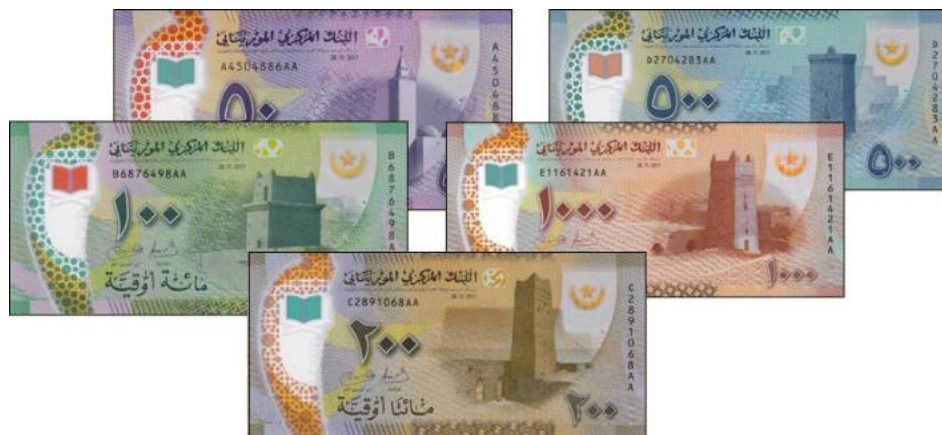
La nouvelle gamme émise au 1 janvier 2018

Les billets sont datés du 28 novembre 2017, date de la fête nationale et annonce par le président de la réforme monétaire..