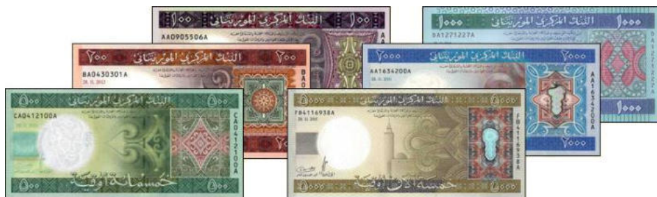
L'ancienne gamme de billets utilisés jusqu'au 31 décembre 2017

L'ancienne gamme de billets comportait 6 valeurs : 100, 200, 500, 1000, 2000 et 5000 ouguiyas .