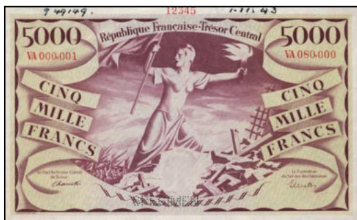
B-03 - Perforé SPECIMEN en bas Vente SPINK 2014