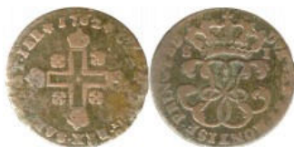
1 sol - 1762 -

La PISTOLE était appelée aussi DOUBLE du côté piémontais ( DOPPIA )