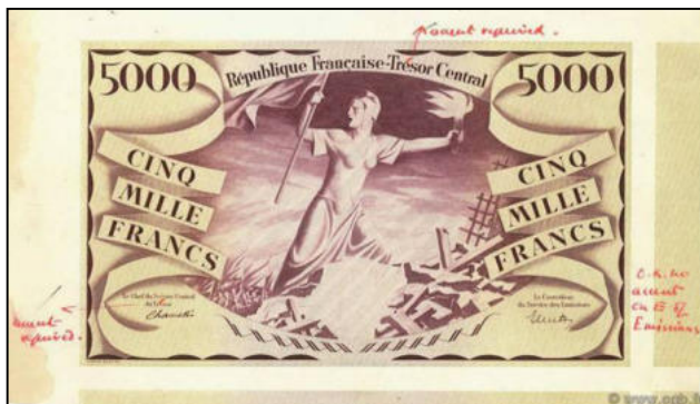
B-01 - EPREUVE sans série et sans numéro Vente cgb.fr