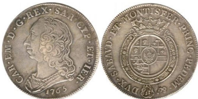
Ecu de 6 livres - 1765 -