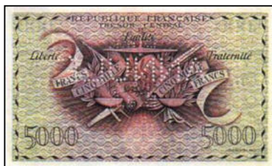
B-04 - Perforé ANNULE au centre Illustration Claude FAYETTE