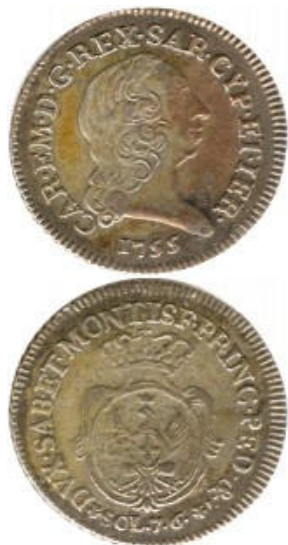
7 sols 6 deniers - 1755 -