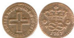
2 deniers - 1767 -