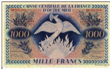
C-14 - Emission pour la Guadeloupe (avec surcharge) Vente cgb.fr