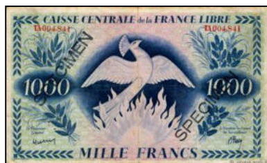
A-03 - SPECIMEN pour St-Pierre et Miquelon (sans surcharge) Vente cgb.fr