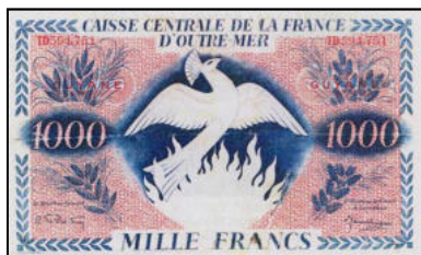
C-17 - Emission pour la GUYANE (avec surcharge) Collection Maison Palombo