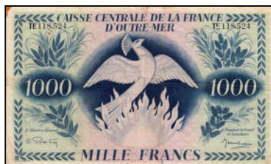
C-23 - Emission pour la Réunion (sans surcharge) Vente alpes-collections.com

Des compléments sur cet article sur internet : https://multicollec.net/3-bi-h2/3h234