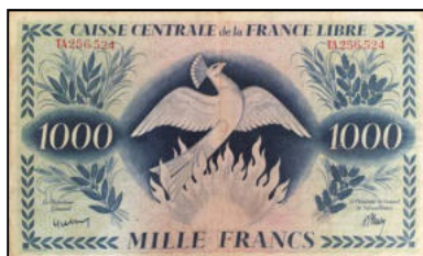
A-17 - Emission pour la Réunion (sans surcharge) Vente alpes-collections.com