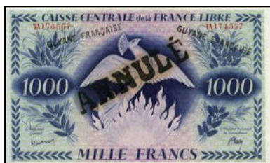
A-12 - Billet ANNULÉ pour la Guyane (avec surcharge) Collection privée