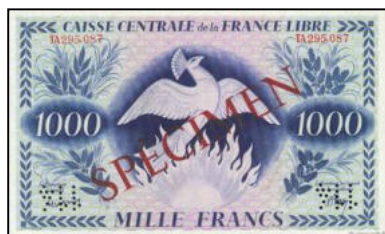
A-20 - SPECIMEN pour l'Afrique Equatoriale Française (Brazzaville) Vente cgb.fr