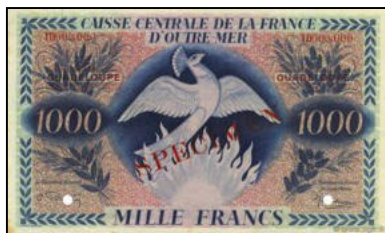
C-01 - SPECIMEN pour la Guadeloupe (avec surcharge) Vente cgb.fr