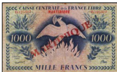
A-08 - Emission pour la Martinique (avec surcharge)