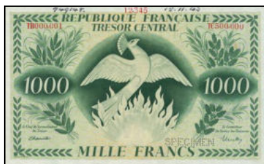
B-03 - Perforé SPECIMEN (daté à la main 15/11/43) Vente Spink 2014