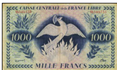
A-30 - Emission pour l'Afrique Equatoriale Française (Brazzaville)