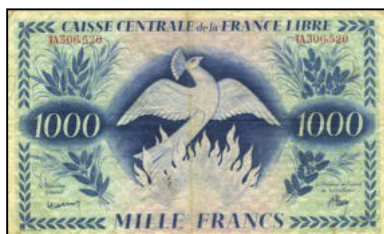
A-21 - Emission pour l'Afrique Equatoriale Française (Douala) Collection privée