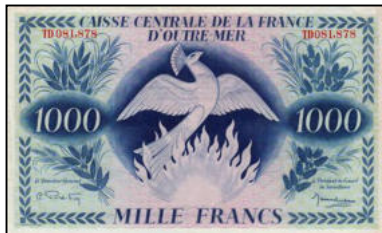
C-07 - Emission pour l'Afrique Equatoriale Française Vente alpes-collections.com