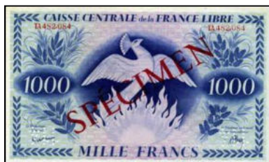
A-28 - SPECIMEN pour l'Afrique Equatoriale Française (Brazzaville) Vente Montay numismatique