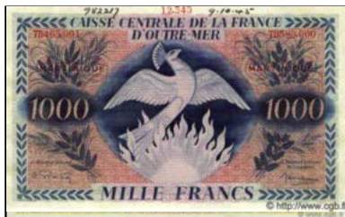
C-16 - Perforation SPECIMEN pour la Martinique (avec surcharge) Vente cgb.fr