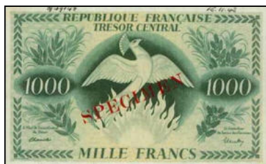
B-01 - SPECIMEN sans série, sans numéro (daté à la main 15/11/43) Vente Spink 2009