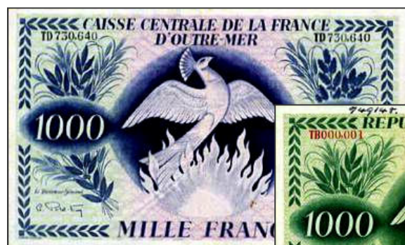
Billet type Phénix pour la France d'Outre-Mer (imprimeur Bradbury & Wilkinson) Vente spink.com