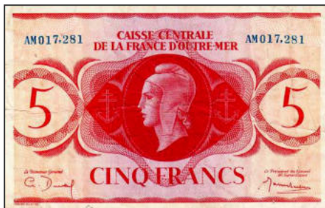
B-05 - Emission pour Saint-Pierre et Miquelon (sans surcharge) Vente alpes-collections.com