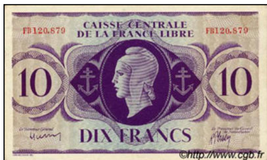
Billet pour la France Libre (imprimeur Bradbury & Wilkinson)

Edmond DULAC orne la majorité des billets avec son portrait de Marianne et dessine aussi deux autres types qu'on retrouve sur les billets de forte valeur faciale : le type Phénix et le type Liberté .