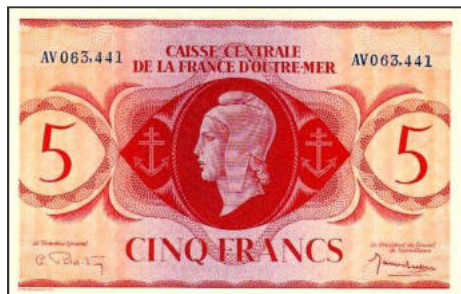
B-13 - Emission pour l'Afrique Equatoriale Française Vente alpes-collections.com