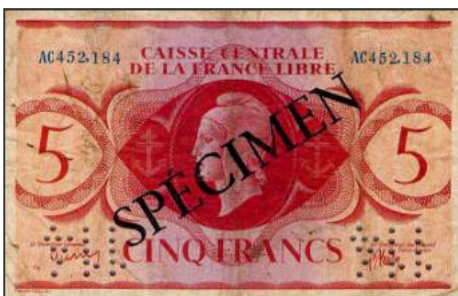
A-07 - SPECIMEN pour l'Afrique Equatoriale Française (Brazzaville) Vente cgb.fr