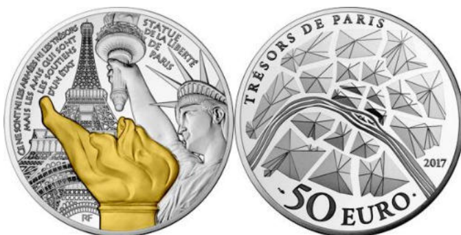
Monnaie, de valeur faciale 50 euros, vendue 494 euros

Comme vous le savez certainement, la Monnaie de Paris frappe et vend des monnaies commémoratives. La majeure partie de ces monnaies de collection est vendue à des prix très élevés par rapport à la valeur faciale de la monnaie.