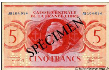
A-05 - SPECIMEN pour l'Afrique Equatoriale Française (Brazzaville) Vente cgb.fr