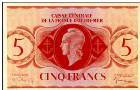
B-19 - Emission pour l'Afrique Equatoriale Française (sans numéro) Vente alpes-collections.com