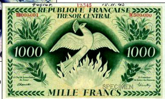
Billet type Phénix pour la France (imprimeur Bradbury & Wilkinson) Vente spink.com