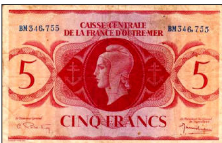
B-18 - Emission pour l'Afrique Equatoriale Française Vente alpes-collections.com