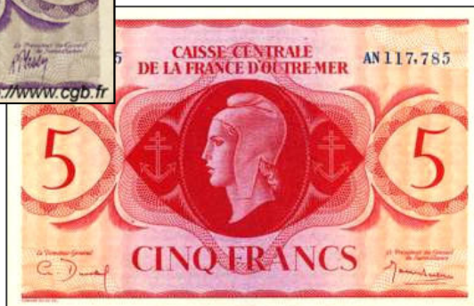
Billet pour la France d'Outre-Mer (imprimeur Bradbury & Wilkinson) Collection privée