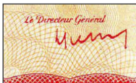
Les signatures de André Diethelm et René Pleven

On les différencie en fonction de leur numérotation.