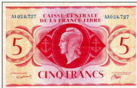
A-01 - Emission pour Saint-Pierre et Miquelon (sans surcharge) Vente alpes-collections.com