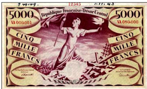
Le type Liberté - Billet non émis prévu pour la France (imprimeur Bradbury & Wilkinson) Vente spink.com