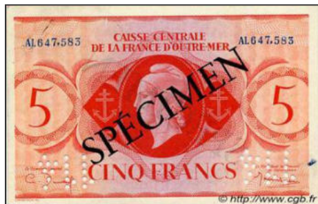
B-04 - SPECIMEN pour l'Afrique Equatoriale Française Vente cgb.fr

Les séries suivantes n'ont pour l'instant pas été retrouvées : AE, AF, AH, AJ, AK, AP, AQ, AR, AY, BA, BB, BD, BE, BF, BH, BL.