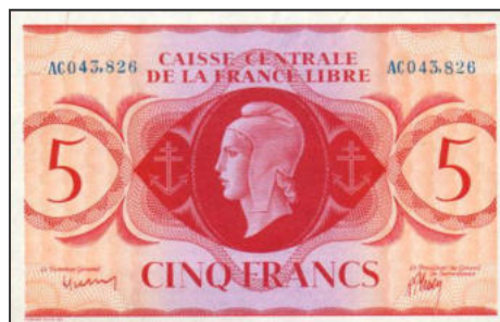
A-06 - Emission pour l'Afrique Equatoriale Française (Brazzaville) Collection privée