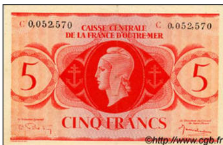
B-22 - Emission pour l'Afrique Equatoriale Française Vente CGB (lettre de la série imprimée avec le billet)

Des compléments sur cet article à l'adresse : https://multicollec.net/3-bi-h2/3h206