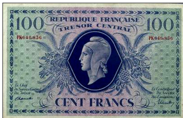
Billet pour la Corse libérée (imprimeur Bradbury & Wilkinson) Vente alpes-collections.com