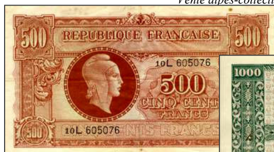
Billets pour la France (imprimeur Thomas de la Rue & Cie) Vente alpes-collections.com