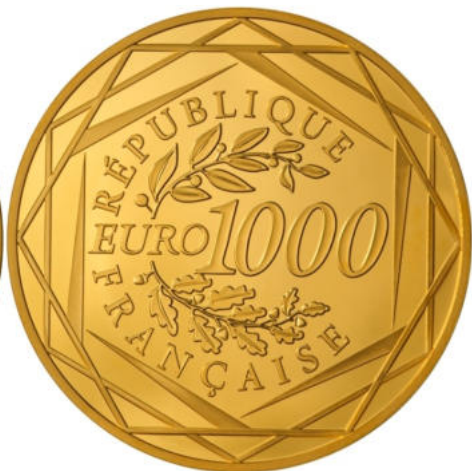
1000 euros - Or 999/1000 - Qualité BU 17 grammes - Diamètre 39 mm Tirage : 10 000 ex.