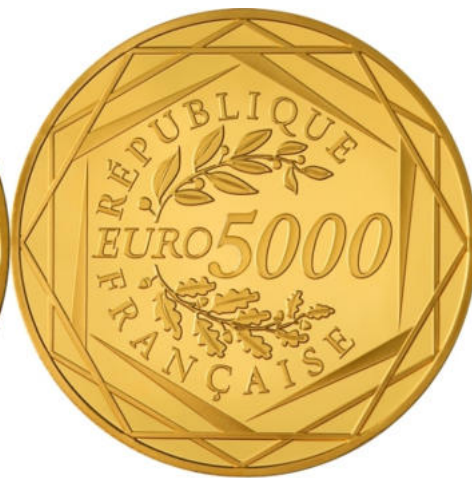
5000 euros - Or 999/1000 - Qualité BU 75 grammes - Diamètre 45 mm Tirage : 2 000 ex.