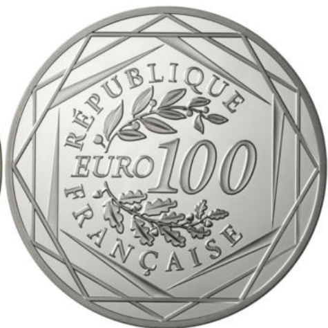
100 euros - Argent 900/1000 - Qualité BU 50 grammes - Diamètre 47 mm Tirage : 50 000 ex.