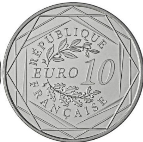
10 euros - Argent 500/1000 - Qualité courante 10 grammes - Diamètre 29 mm Tirage : 500 000 ex.