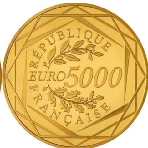
5000 euros - Or 999/1000 - Qualité BU 75 grammes - Diamètre 45 mm Tirage : 2 000 ex.