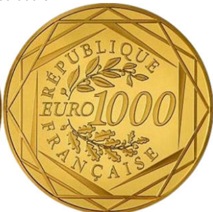
1000 euros - Or 999/1000 - Qualité BU 20 grammes - Diamètre 39 mm Tirage : 10 000 ex.