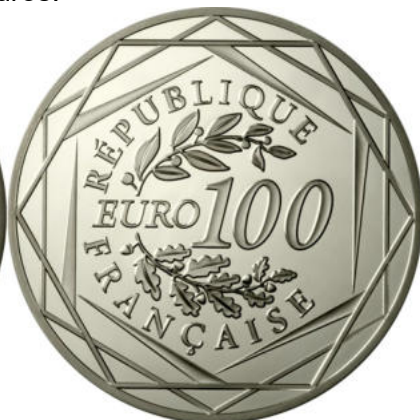
100 euros - Argent 900/1000 - Qualité BU 50 grammes - Diamètre 47 mm Tirage : 50 000 ex.