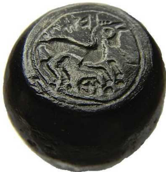
Fig. 1 : Le coin monétaire

Un nouveau coin monétaire gaulois en bronze ( fig. 1 ) m'a été communiqué par un collectionneur. Le type monétaire représenté est le revers de la drachme allobroge aux caractères lépontiques jusqu'à présent lus " IAZVS ".