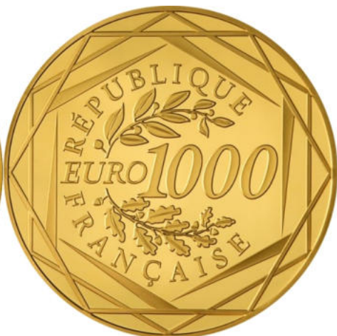
1000 euros - Or 999/1000 - Qualité BU 20 grammes - Diamètre 39 mm Tirage : 10 000 ex.