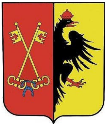
Blason de Moûtiers A partir du 11 ème siècle

On retrouve sur le blason de cette époque les symboles du pouvoir spirituel à gauche avec les clefs liées entre elles symbolisant l'apôtre Pierre (1) , et à droite l'aigle impérial symbolisant le pouvoir temporel. Dans la lecture héraldique, il faut noter que pour les blasons en deux parties verticales, la partie droite représente toujours un élément de moindre importance que celui de la partie gauche. On a donc une hiérarchie dans les pouvoirs, le pouvoir spirituel primant sur le pouvoir temporel.