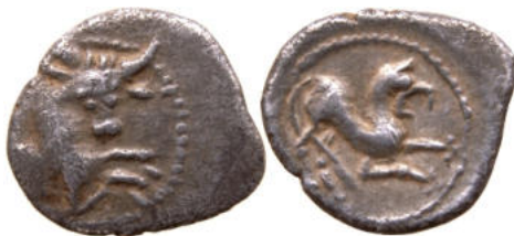
DT III 3173 A

Cette monnaie DT 3173 A aurait été trouvée dans les années 1990 au nord-est d'Annecy (Haute-Savoie), en compagnie de plusieurs drachmes de la série DT III, 863 « au cheval galopant », toutes appartenant au groupe B dit « au profil stylisé ».