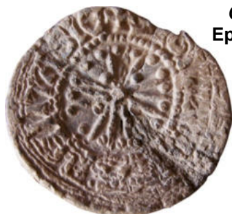
Collection E.H. Epaisseur 3,5 mm Ø 31 mm

J'ai eu la chance de rencontrer par la suite, un second collectionneur qui possédait un sceau identique.