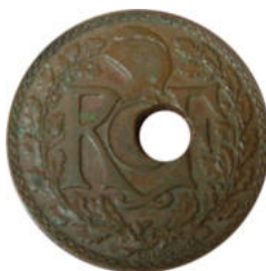
1936 - Réf : L-28