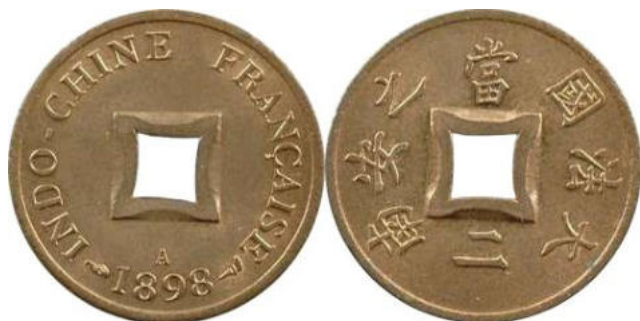
Sapèque indochinois - 1898 - Réf : L-14

Pour faciliter la transition monétaire et aussi s'adapter au système monétaire local, le gouvernement colonial français fit frapper des sapèques portant la mention Indochine Française de 1887 à 1902. On peut remarquer d'ailleurs que le trou carré traditionnel des sapèques fut conservé.