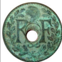
1935 - Réf : L-27

Je vais vous présenter ci-après quelques monnaies fautées appartenant à la collection P.C.