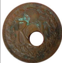
1938 - Réf : L-30