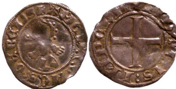
type A-2 - Ø 21,8 à 23 mm - 1,431 gr - collection du Cabinet de numismatique du Musée d'art et d'histoire de Genève (réf : CdN 16853)