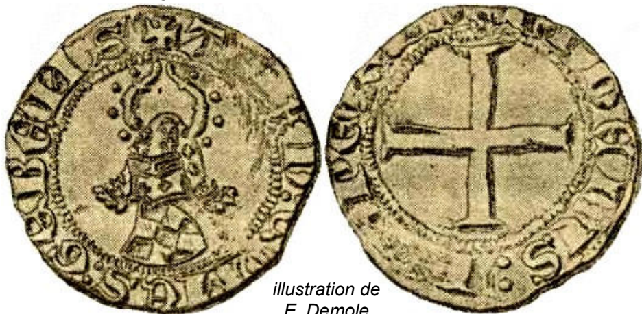
illustration de E. Demole

Titre d'argent fin : 667/1000 e et ensuite 500/1000 e