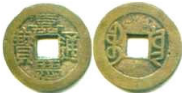
Empereur Kia-King (1795-1820) Sapèque provenant de la Chine du Sud

Jusqu'à la fin du XIX ème siècle, la plupart des provinces de l'Indochine utilisaient comme petites monnaies les sapèques . Leur valeur monétaire était très faible : 2/1000 ème de piastre .