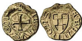
illustration de E. Demole