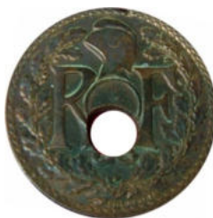
1939 - Réf : L-31