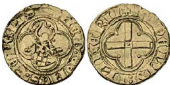
illustration de E. Demol