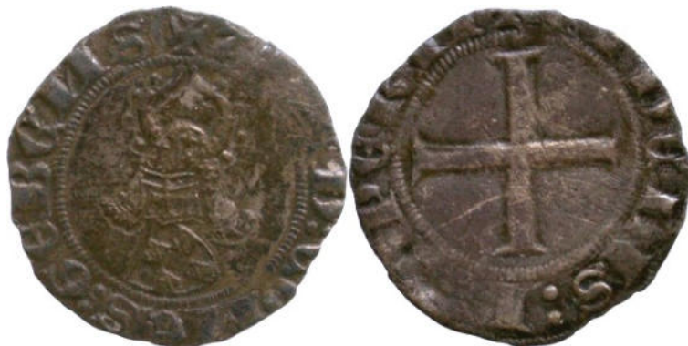
type A-2 - Ø 20,9 à 21,7 mm - 1,644 gr - collection du Cabinet de numismatique du Musée d'art et d'histoire de Genève (réf : CdN 16852)