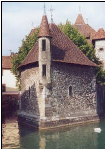
Le Palais de l'Isle à Annecy

De 1356 à 1362, des florins, sizains, deniers et oboles furent frappés au nom du Comte Amédée III .