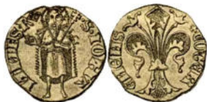
illustration de E. Demole