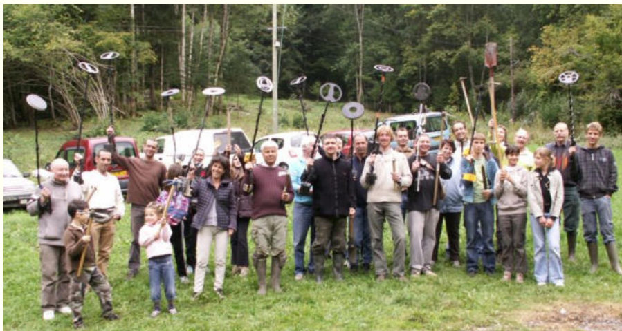
Les participants se préparent pour la première manche....

Notre traditionnel rendez-vous au plateau d'Andey a réuni cette année 36 participants pour la chasse au trésor auxquels se sont rajoutés quelques adhérents venus participer le samedi soir et le dimanche midi à nos repas.