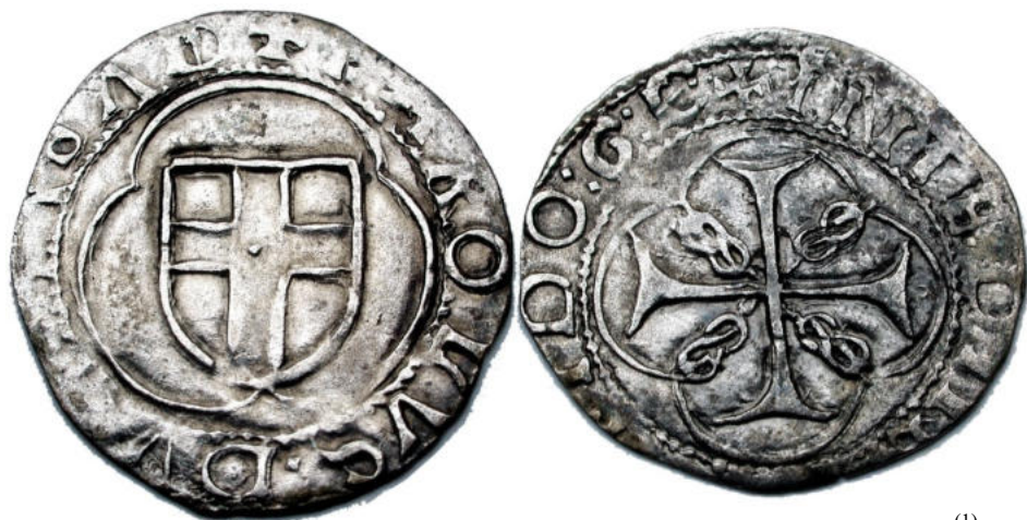
Illustration avec la référence Cudazzo 403c

On constate sur le type standard qu'à l'avvers la légende est simplifiée ( KAROLVS au lieu de KAROLVS II ) et qu'au revers il est indiqué le sigle du monnayeur en fin de légende.