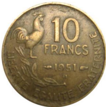
Photo prise en utilisant un miroir