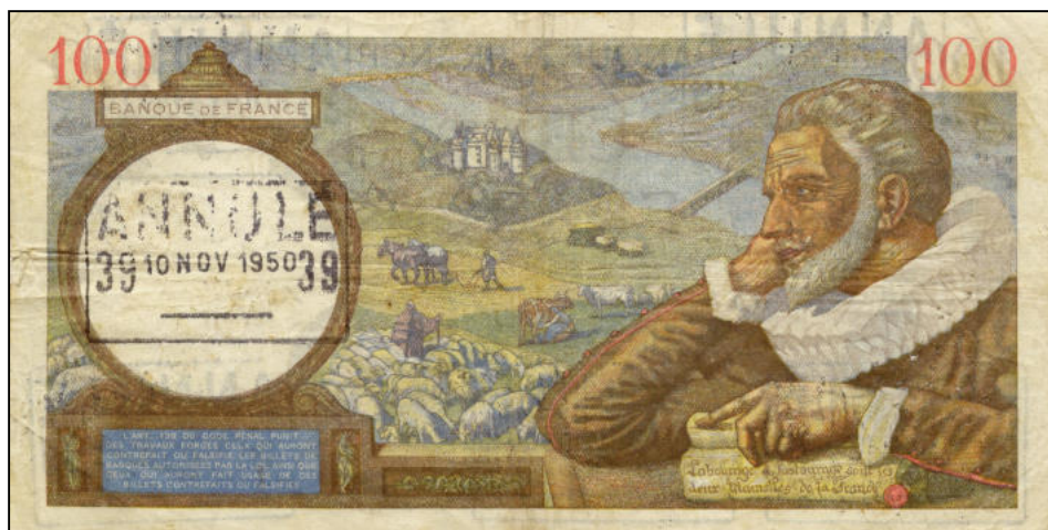
Au verso 1 seul timbre humide « ANNULÉ » couvre la zone du filigrane

Le billet illustré ci-dessus a été présenté le 10 novembre 1950 au guichet 39 de la Banque de France pour remboursement.