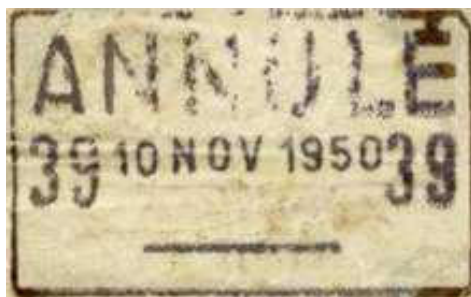
Cachet « ANNULÉ » en date du 10 novembre 1950

Le billet illustré ci-dessus a été présenté le 10 novembre 1950 au guichet 39 de la Banque de France pour remboursement.