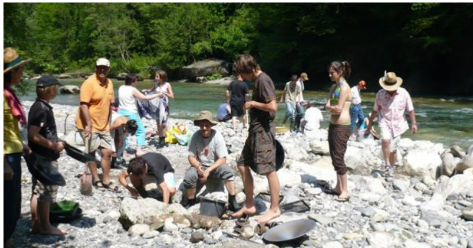
Quelques photos de cette journée.....