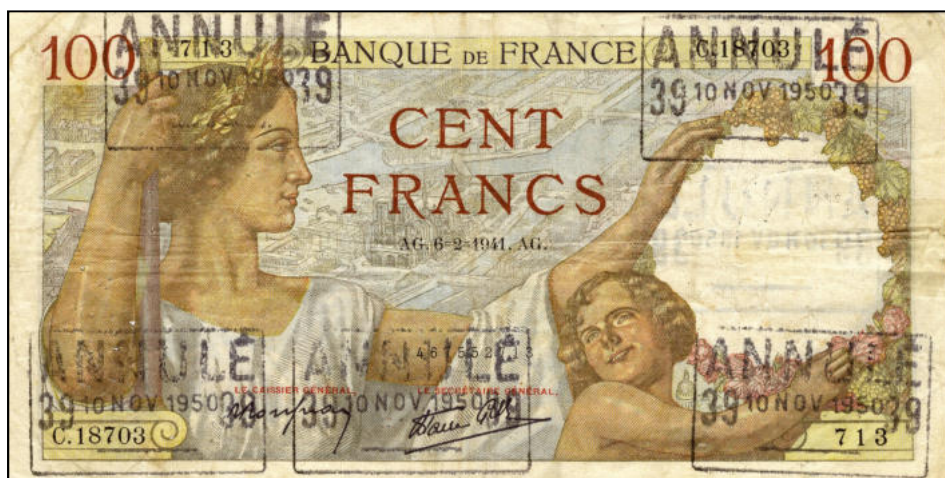
couvrant les numéros du billet et les diverses signatures

Le préposé au guichet se devait alors d'annuler les billets à l'aide d'un cachet encreur, au recto sur les signatures et sur les différents numéros du billet, au verso sur le filigrane.