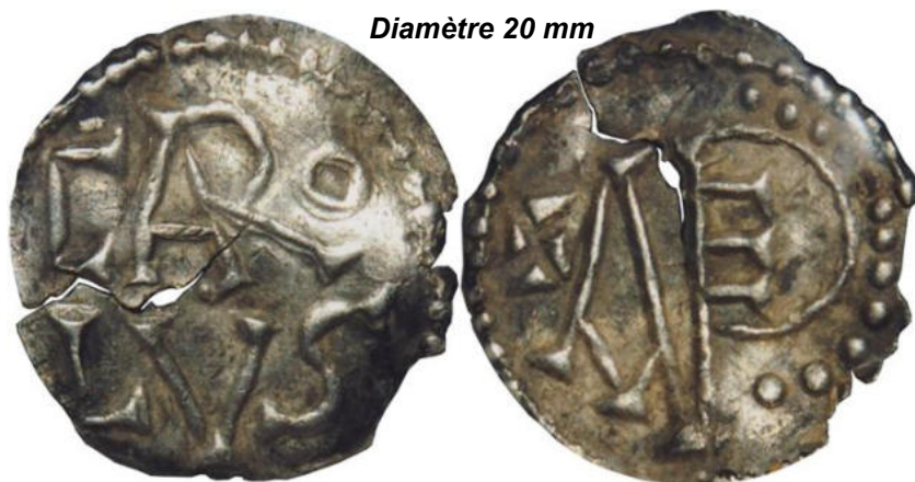
Diamètre 20 mm