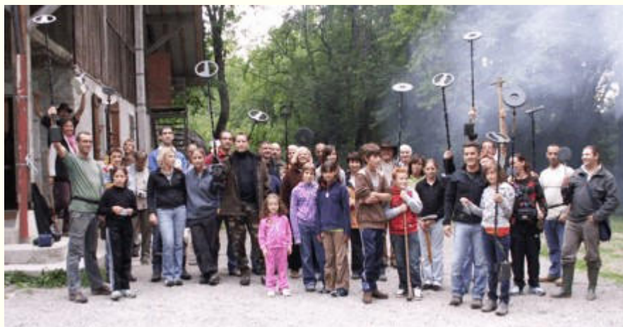
Les adhérents attendant le départ de la chasse au trésor....