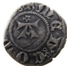
Denier de Amédée V comte de Savoie