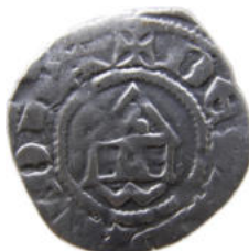
Denier de Louis baron de Vaud