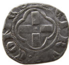
Denier de Pierre comte du Genevois