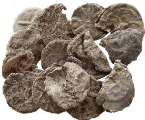
un ensemble de Méreaux dégradés