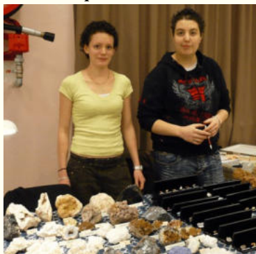
Le stand des minéraux