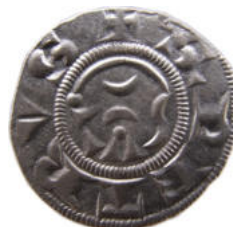
Denier anonyme des évêques de Genève