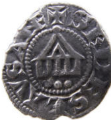
Denier anonyme des évêques de Lausanne