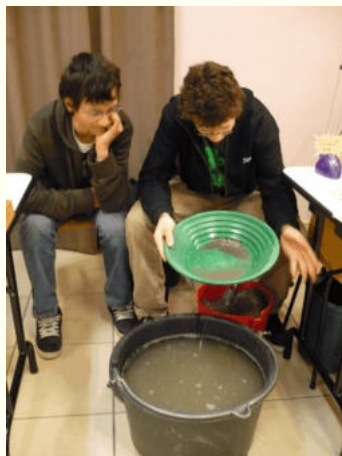
Démonstration de l'utilisation de la batée par les orpailleurs