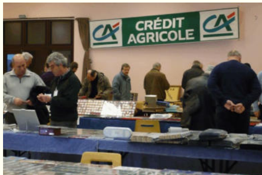
Une vue partielle de la salle

Cette 27 ème édition de notre Salon Numismatique et Placomusophile a remporté comme chaque année un vif succès. Nous avons accueilli toute la journée un nombre très important de visiteurs.