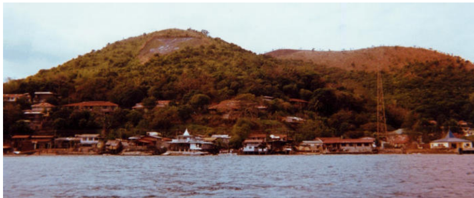
L'île de Culion de nos jours, on aperçoit un sigle tracé sur le haut de la colline : PHS avec un aigle aux ailes déployées (Philippine Health Service - Service Philippin de la Santé)