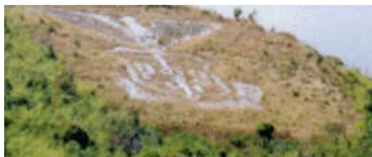
Le sigle PHS en haut de la colline

Dans le langage populaire, l'île de Culion était appelée « île des morts-vivants », cette dénomination nous permet peut-être de mesurer sinon d'appréhender quelque peu la détresse et la misère de ces hommes et de ces femmes atteints par la maladie.