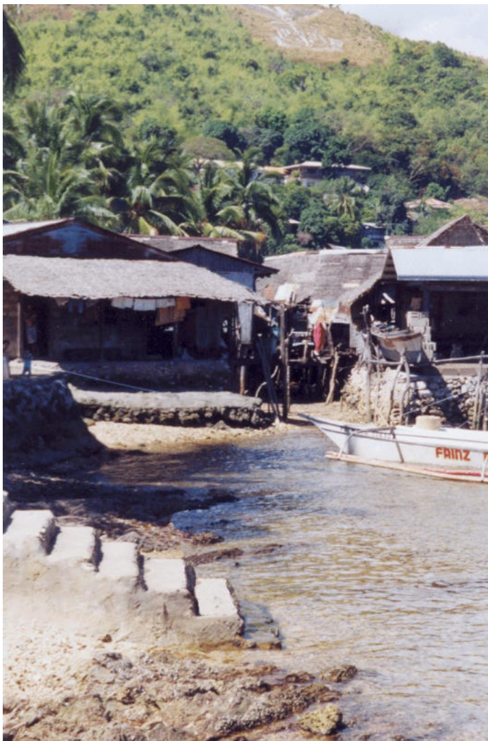
Culion : l'embarcadère pour les pirogues des pêcheurs