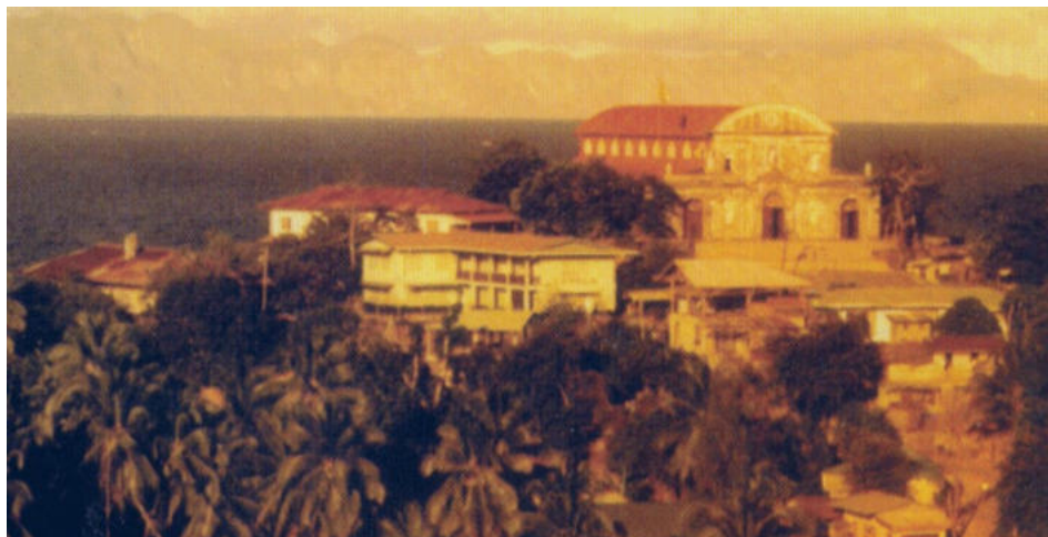
L'Eglise de Culion et ses alentours