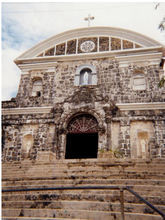
L'Eglise de Culion construite sur un ancien fortin

Cette cité des lépreux ressemblait presque à une cité ordinaire, avec ses diverses corporations. Pour la faire vivre, il fallait du numéraire pour payer les diverses tâches, acheter les marchandises, etc.... Or tout le monde était persuadé que les monnaies et billets « souillés » par les lépreux étaient contaminés, d'où une fabrication de monnaies spéciales uniquement pour cette communauté isolée.