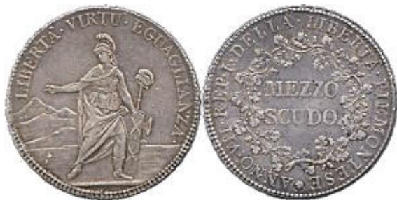
République piémontaise Demi écu - An VII -

Durant toute cette période plusieurs monnayages ont eu cours : les anciennes monnaies du royaume de Sardaigne, les monnaies de la république Piémontaise, les monnaies de la Gaule Subalpine, les monnaies françaises de manière prépondérante et les monnaies autrichiennes.