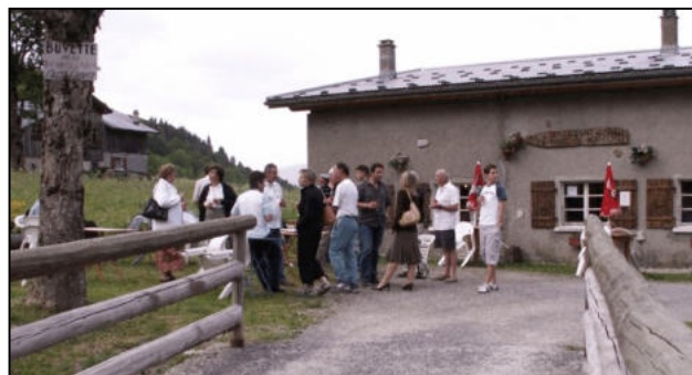
Les adhérents réunis pour l'apéro devant l'auberge de « La Pointe du Midi »