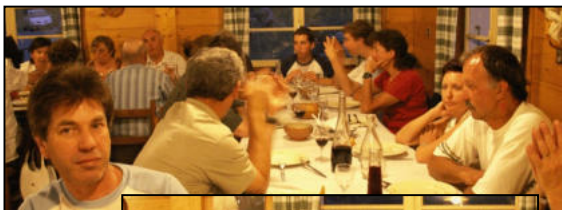
Nous nous sommes retrouvés nombreux pour déguster les spécialités montagnardes.