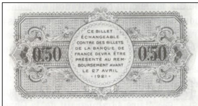
Illustration tirée du fascicule ANNESCI - n° 27