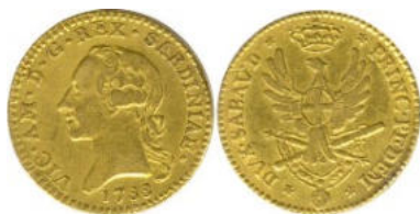
Nouvelle pistole de 24 livres - 1788 –

De plus il sera fabriqué de nouvelles pistoles de 24 livres, avec leurs demies, leurs quarts et leurs multiples de 60 et 120 livres.