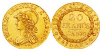
République subalpine - 20 francs - An 10 - (monnaie appelée « 20 francs Marengo »)