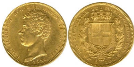
100 livres - 1834 – (nouvelle dénomination)

Ce n'est qu'à partir de 1831, sous Charles-Albert que les dénominations anciennes disparaissent définitivement pour être remplacées par leur valeur en livres. Les pièces de 40 livres et 80 livres sont alors remplacées par des pièces de 50 livres et 100 livres.