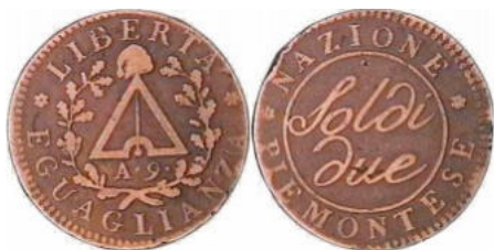
République subalpine - 2 sols - An 9 - (vente CGB – Monnaie VI – n° 3953)

Durant toute cette période plusieurs monnayages ont eu cours : les anciennes monnaies du royaume de Sardaigne, les monnaies de la république Piémontaise, les monnaies de la Gaule Subalpine, les monnaies françaises de manière prépondérante et les monnaies autrichiennes.