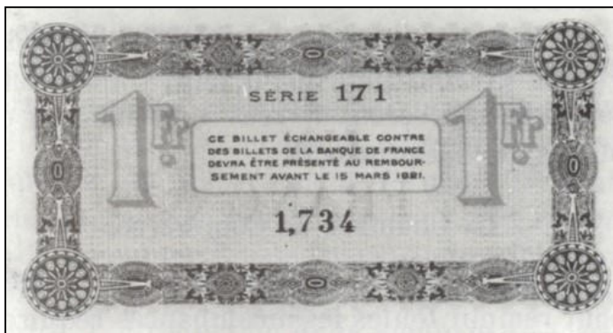
Illustration tirée du fascicule ANNESCI - n° 27