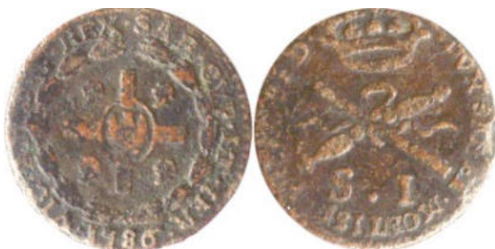
1 sol de l'île de Sardaigne - 1786 – (dimension réelle 19 mm)

Cette réforme monétaire ne concernait que les monnaies frappées pour l'île de Sardaigne. Pour les états de terre-ferme possédés par le roi de Sardaigne la réforme de 1755 continuait à s'appliquer.