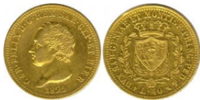
Pistole de 40 livres - 1825 – (ancienne dénomination)

Ce n'est qu'à partir de 1831, sous Charles-Albert que les dénominations anciennes disparaissent définitivement pour être remplacées par leur valeur en livres. Les pièces de 40 livres et 80 livres sont alors remplacées par des pièces de 50 livres et 100 livres.