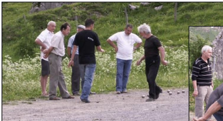
Les « pros » de la pétanque attendant l'apéritif ....