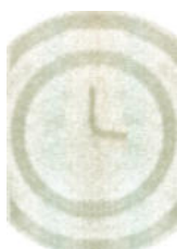
Filigrane « cadran horaire » pour les 4 coupures