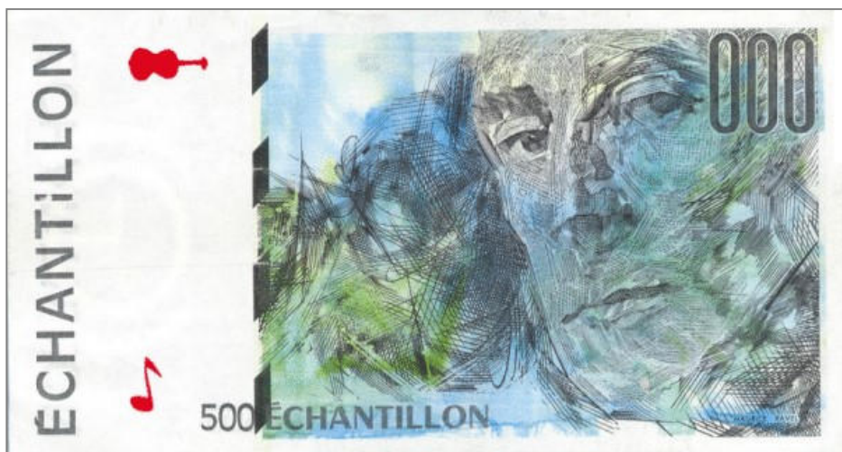
Echantillon correspondant au 500 FRANCS – CURIE