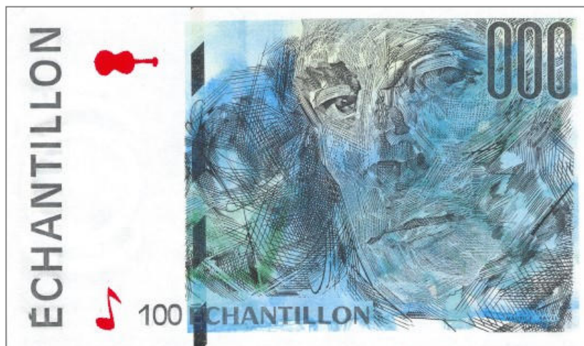
Echantillon correspondant au 100 FRANCS – CEZANNE

Ces coupures comportent un certain nombre de signes de sécurité : filigrane, dessin avec encre simulant un changement de couleur, fil de sécurité et strap. Elles portent en petit la mention de la valeur du billet authentique (50, 100, 200 ou 500).