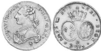
LOUIS XVI, double Louis d'or au buste habillé 1775 Rouen