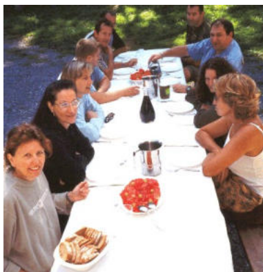
L'une des tablées d'affamés...