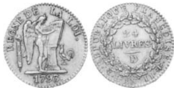
CONVENTION, Louis d'or de 24 livres 1793 Lyon

Ce Manifeste a été mis en place sous le règne du roi Charles-Albert (1831-1849)