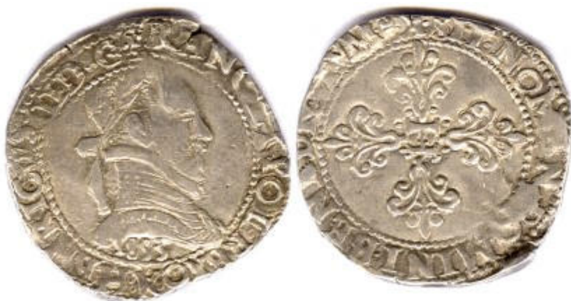
Franc en argent frappé à Bordeaux en 1583 (avec date 1853)