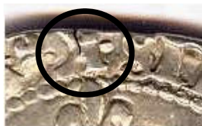
K au revers

- maître de la monnaie de Bordeaux, Fort ARNAULT (1583-1587), avec sa marque : un cercle en fin de légende de l'avers