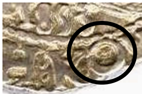
cercle en fin de légende de l'avers

- maître de la monnaie de Bordeaux, Fort ARNAULT (1583-1587), avec sa marque : un cercle en fin de légende de l'avers