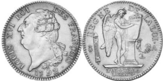
CONSTITUTION, Ecu de 6 livres 1792 Paris