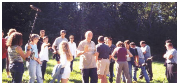
Dernier briefing avant le départ de la chasse au trésor...