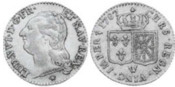
LOUIS XVI, Louis d'or au buste nu 1787 Lille