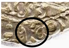
K à l'avers

- monnaie frappée à Bordeaux , lettre de l'atelier de Bordeaux K en fin de légende de l'avers et du revers, à noter que pour le revers la lettre K est gravée à l'envers