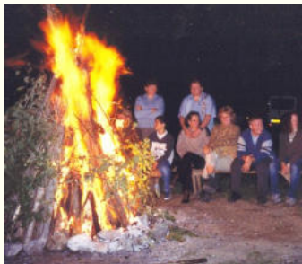
un feu de camp réussi...

Nous allons revivre en images les temps forts de ce week-end.