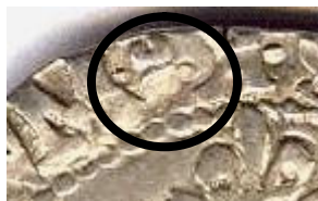
deux croissants opposés au revers après BENEDICTVM

Pour un tirage en 1583 de 144.244 exemplaires pour l'atelier de Bordeaux, il aura fallu de nombreux coins pour frapper une aussi importante quantité de monnaies.