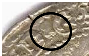
deux croissants opposés à l'avvers entre D et G

- graveur de la monnaie de Bordeaux, Domingue DE HARIET (1573-1592), avec sa marque : deux croissants opposés entre D et G à l'avvers et en fin de légende du revers