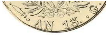
An 13 - POISSON différent de E-A FROIDEVAUX

Bien qu'en piteux état, cette monnaie est malgré tout le seul exemplaire connu du demi-franc de l'an 13 frappé à Genève. Elle est donc de la plus grande rareté..... □