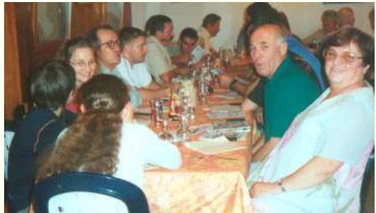
le repas de rentrée

Ce dernier trimestre a été l'occasion de plusieurs manifestations : tout d'abord notre repas de rentrée le 20 septembre, suivi de notre participation au 1er forum inter-association de cluses le 22 septembre, notre sortie orpaillage du 28 septembre, et notre participation à la Bourse Numismatique Internationale GENEVA 2002 le 17 novembre à l'Hôtel Hilton de Genève.