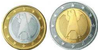
1 et 2 euros Aigle allemand