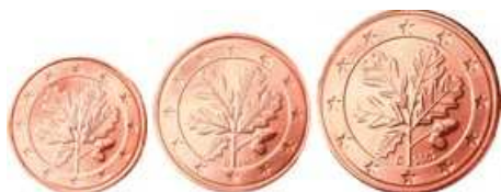
1, 2 et 5 centimes Feuille de chêne