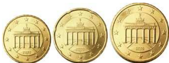
10, 20 et 50 centimes Berlin - Porte de Brandebourg