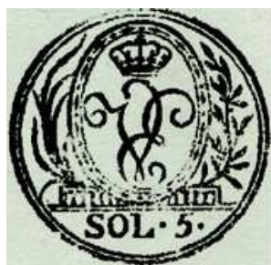
5 sols sur un doc. de 1818