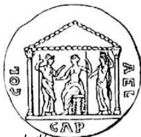
Judée La triade capitoline Bronze de Hadrien

4- La Palestine devint province romaine en l'an 6 de notre ère. Elle comprenait la Galilée, la Samarie et la Judée. Elle était gouvernée par un proconsul qui résidait non pas à Jérusalem, mais à Césarée.