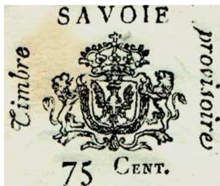
Rare cachet « provisoire » sur un doc. de 1815