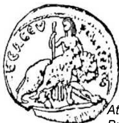
Hiéropolis Atargatis assise sur un lion Bronze de Caracalla

Hiéropolis, sanctuaire de la déesse Syrienne Atargatis, était une ville sainte (à ne pas confondre avec Hiéropolis de Phrygie qui était le sanctuaire de Cybèle).