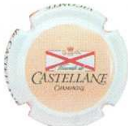
Rosé (fond saumon)