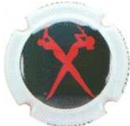
Duo de Jazz CANETTI