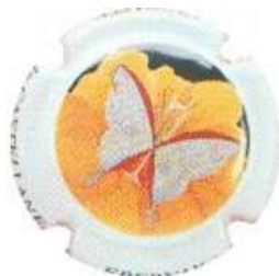
Le Papillon BARIDEAU