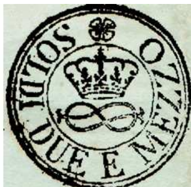
2 sols et ½ sur un doc. de 1816