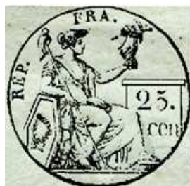
25 centimes sur un doc. de l'an 13