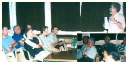
Une assemblée très attentive