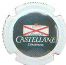
Millésime (fond gris)