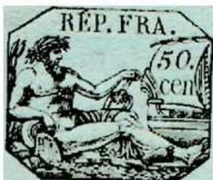
50 centimes sur un doc. de l'an 13