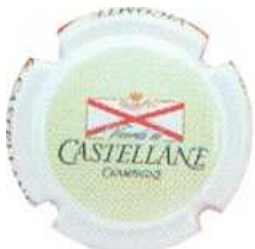
Chardonnay (fond vert clair)