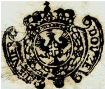
12 deniers sur un doc. de 1734