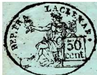
50 centimes sur un doc. de l'an 10