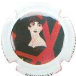
Femme – PETROZZIAN