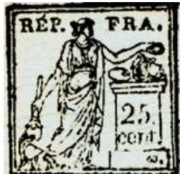
25 centimes sur un doc. de l'an 8