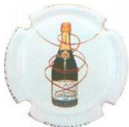
L'inauguration L. CASTIGLIONI