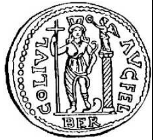
Berytus Astarté couronnée Bronze de Gallien

Berytus, Beyrouth actuelle, est célèbre pour son temple d'Astarté, « l'Aphrodite syrienne », déesse de l'amour et de la fécondité.