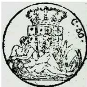
30 centesimi sur un doc. de 1818