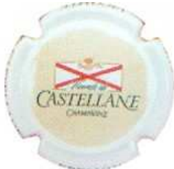
Demi-sec (fond beige)