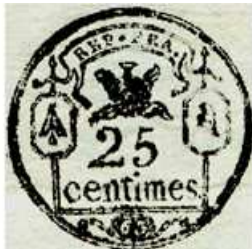
25 centimes sur un doc. de l'an 3