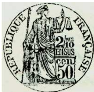
50 centimes sur un document de 1895

Ces cachets sont très faciles à trouver et à l'achat encore peu onéreux. J'espère que cette courte présentation suscitera quelques nouvelles vocations de collectionneur.