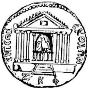
Emèse Temple d'Elagabal Bronze de Caracalla