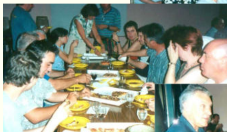
La conférence s'est poursuivie par un sympathique lunch...