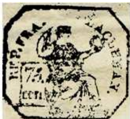
75 centimes sur un doc. de l'an 8