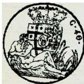
40 centesimi sur un doc. de 1818