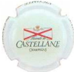
Brut (fond ivoire)