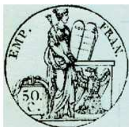
50 centimes sur un doc. de 1811