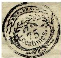
75 centimes sur un doc. de l'an 8