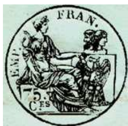
75 centimes sur un doc. de 1806