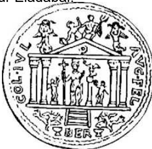
Berytus Temple d'Astarté Bronze d'Elagabal