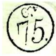
25 centimes et 75 centimes juxtant le cachet « Pais occupés » sur des doc. de 1814