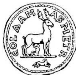
Damas Biche allaitant un enfant Bronze de Trébonien

Damas, actuellement ville de 2 millions d'habitants et capitale de la Syrie, fut « le grain de beauté du monde », « le calice au milieu des fleurs », dans une plaine très fertile. Les romains en firent une cité très prospère.