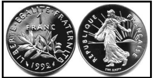
République Française 1 franc - 1992

A la veille du passage à l'Euro, il peut être bon de se remémorer brièvement les origines du FRANC symbole monétaire de la nation française.