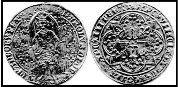
Charles V - Franc d'or à Pied - 1364

Cette monnaie, moins lourde que la précédente pesait un gros (3.824gr), et on frappait 64 pièces dans un marc d'or fin.