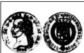
Pistole de vingt livres

Nous déclarons en outre que le poids et le titre des monnaies ci-dessus étant les mêmes que ceux des monnaies de même espèces en cours dans les Etats voisins, les pièces d'or sont à la taille de 155 pièces au kilogramme et au titre de 900 millièmes, et les pièces d'argent à la taille de 40 pièces au kilogramme, ou de 25 grammes par chaque pièce, et également au titre de 900 millièmes. »