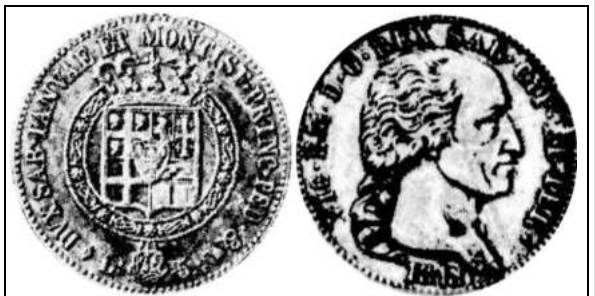
Ecu de cinq livres